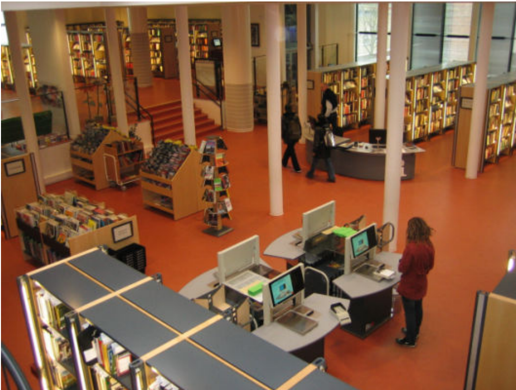
'Torvet' på Vanløse Bibliotek