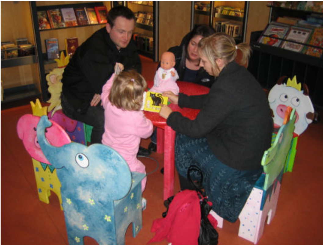
Familiesamvær i børneafdelingen på Vanløse Bibliotek

En anden eftermiddag er der et mylder af voksne og børn på Torvet i biblioteket og et højt lydniveau. Et spædbarn i barnevogn græder højt og længe. Den unge mor har også sin 3-årige søn med, som skal tisse, så moderen tager ham med ud på handicaptollet. Bagefter triller hun barnevognen ind på Læsesalonen, tager det stadig grædende spædbarn op og ammer det. Med barnet ved brystet læser hun samtidig højt for den 3-årige. Eksemplet med denne kvinde viser, hvordan man som bruger kan udnytte og udvide biblioteket som mulighedsrum, fx ved at amme sit barn og bruge de gode stole i Læsesalonen til at sidde med sønnen og læse højt – måske uintenderede muligheder, da man tegnede biblioteket.