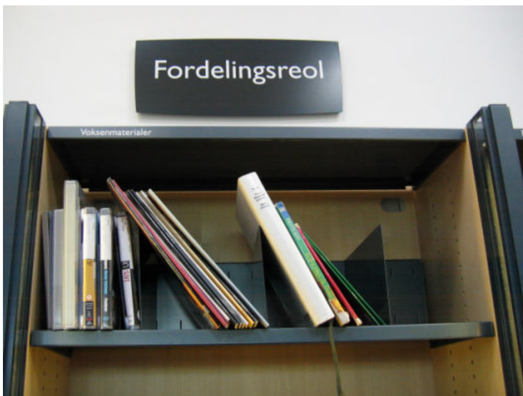
Øverste hylde i fordelingsreolen på Vanløse Bibliotek

På Vanløse Bibliotek observerede vi interessant aktivitet ved fordelingsreolen, hvor brugerne selv skal sætte afleverede materialer på plads efter at have kørt dem igennem låneautomaten. Mange brugere leder efter andres nyafleverede bøger i fordelingsreolen, således også den tidligere nævnte 2-årige datter med den ølbog-interesserende far, og kvinden med 'Shopaholic'-bøger, der næsten altid fandt noget i fordelingsreolen, hun ikke havde regnet med.