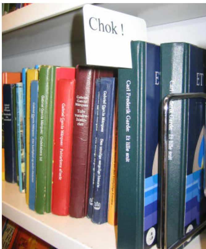
Brugere på Københavns Hovedbibliotek kan vise andre brugere, hvad de mener om en bog